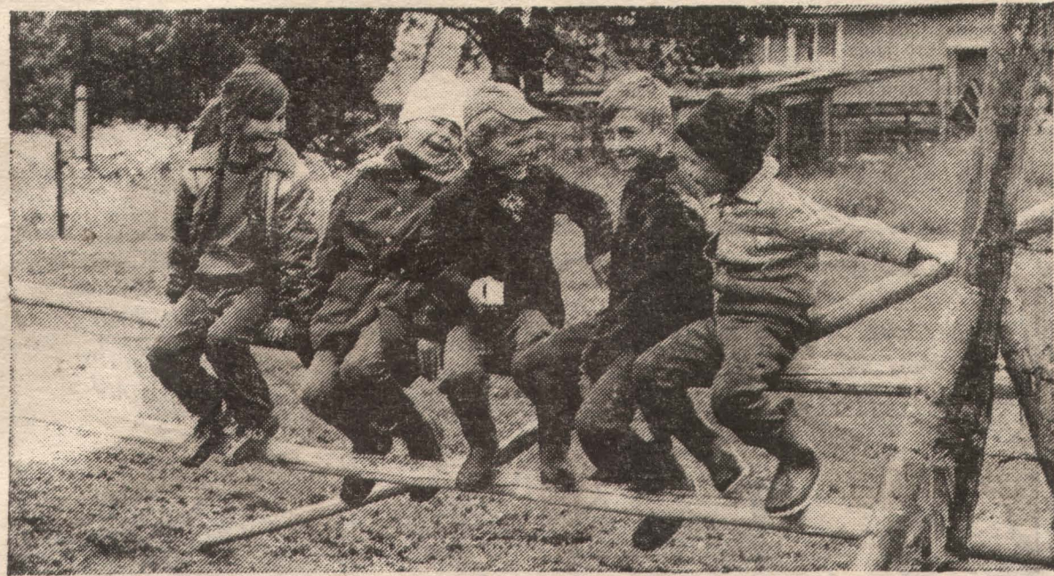
Вот такие посиделки устраивают ребята из деревни Домаша Валдайского района Новгородской области.